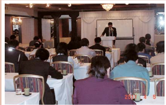
決算法人説明会 (3・4月期)