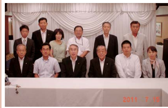
公益認定推進委員会発会式