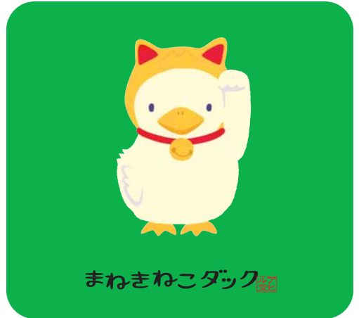
まねきねこダック