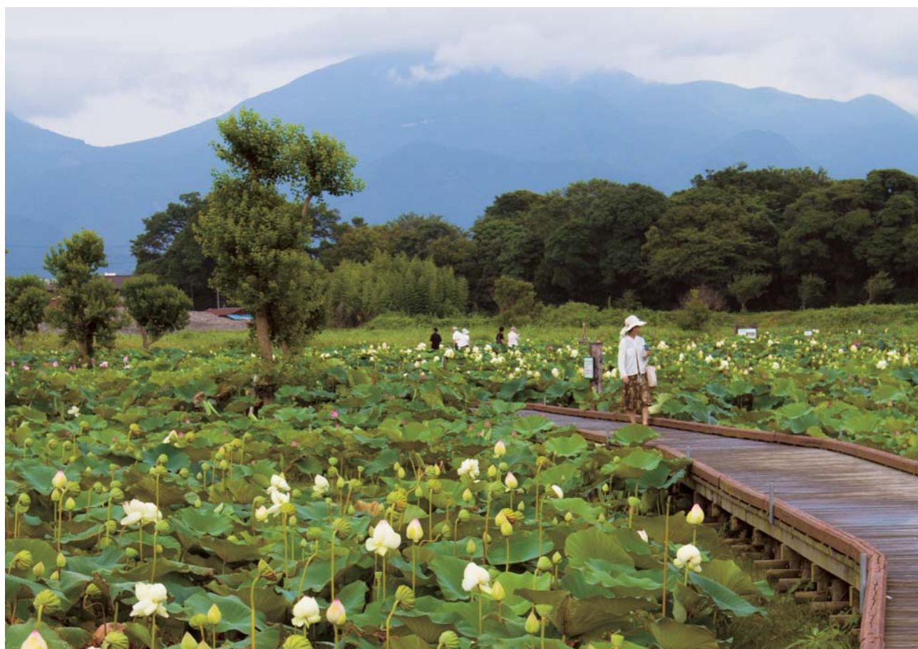
唐比八ス園 (森山町)

発行所／諫早市厚生町3-20 大同生命諫早営業所2F 社団法人 諫早大村法人会 TEL0957-22-8479 印刷所／諫早印刷株式会社