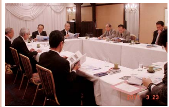
正副会長会及び総務委員会