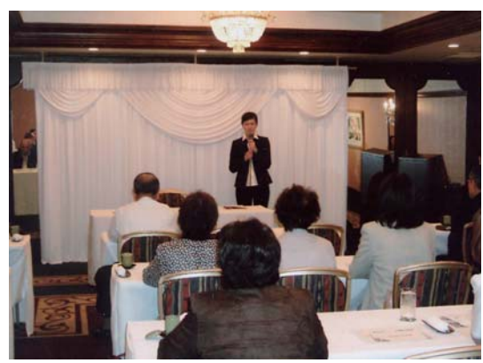
9月29日 介護セミナー