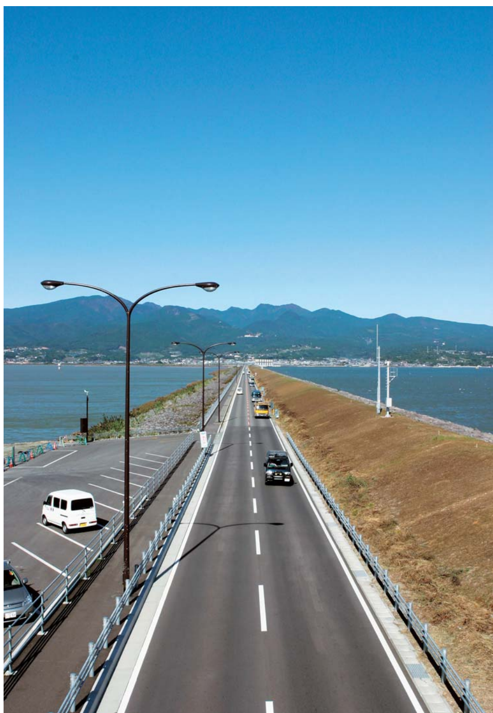
諫早湾干拓潮受堤防道路より多良岳を望む (右側：有明海、左側：調整池)