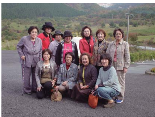
11月5日 女性部会視察旅行